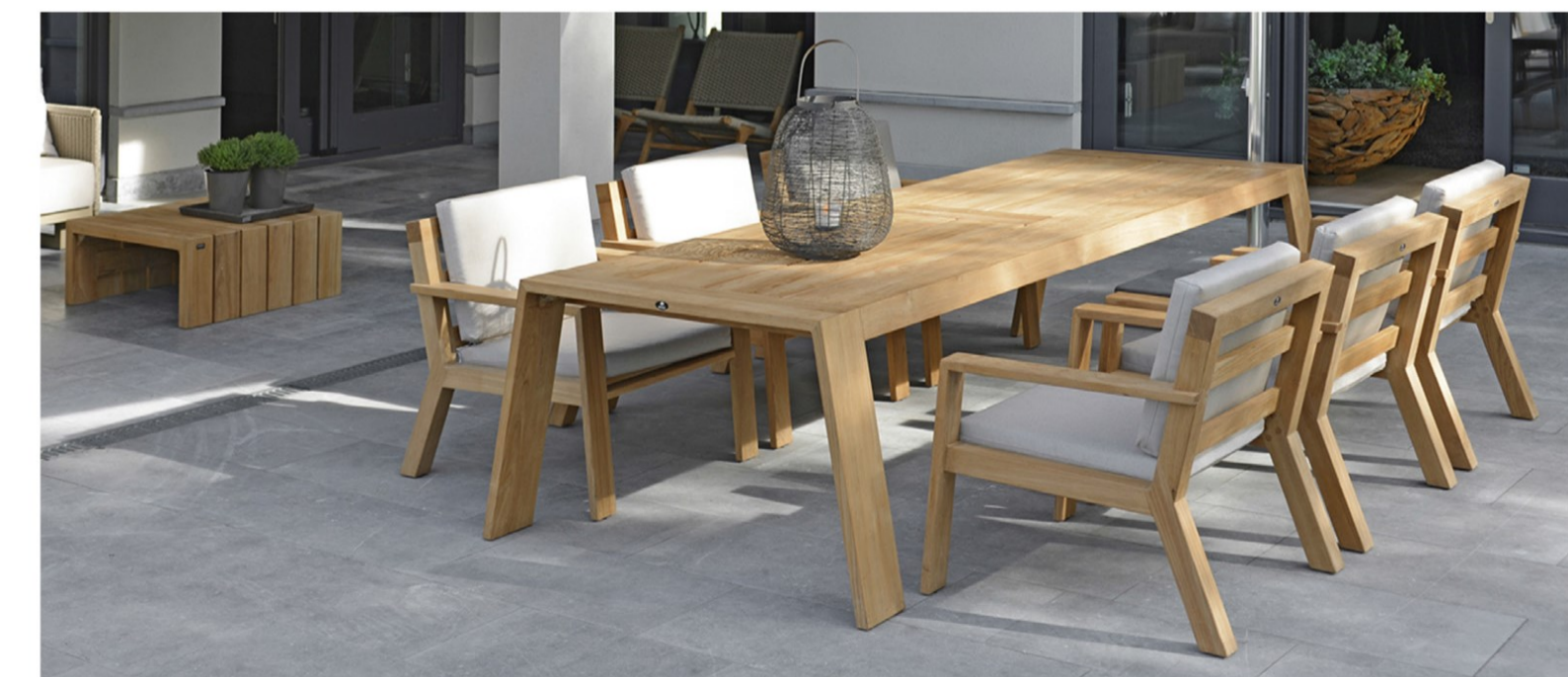
Borek Viking 6P low dining set in teak

recent de Panama-serie. “Van Borek krijg ik nagenoeg carte blanche. Er is duidelijk sprake van wederzijds respect voor eenieders tak van sport. Een zeer prettige basis om samen te werken. We versterken elkaar. Wat de samenwerking extra hecht maakt, is dat ik geen ontwerper ben die alleen mooie dingen bedenkt. Ik