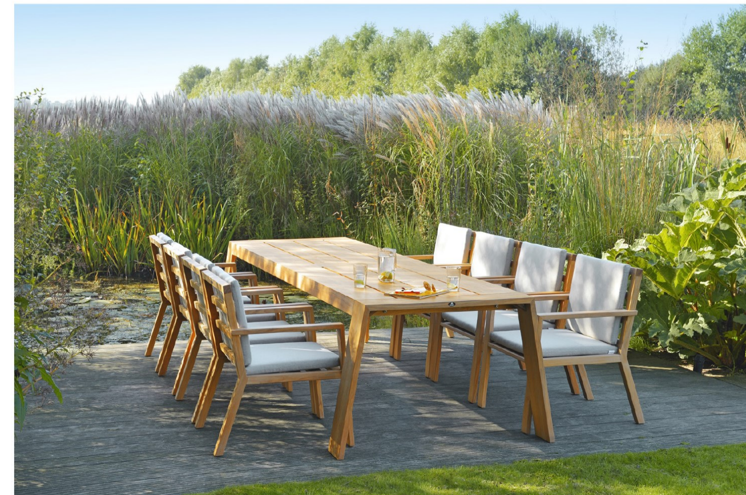
Borek Viking 8P diner set in teak

opererende bedrijf strikt aan hoe de familie uit dient komen te zien. "Dan volgt een duidelijke briefing en afgekaderd wensenpakket. Waar hebben ze behoefte aan, welke samenstellingen, welke kleuren? Alles komt dan op tafel. Borek heeft in al die jaren natuurlijk een enorme marktkennis opgedaan en weet precies wat er speelt en gewenst wordt."