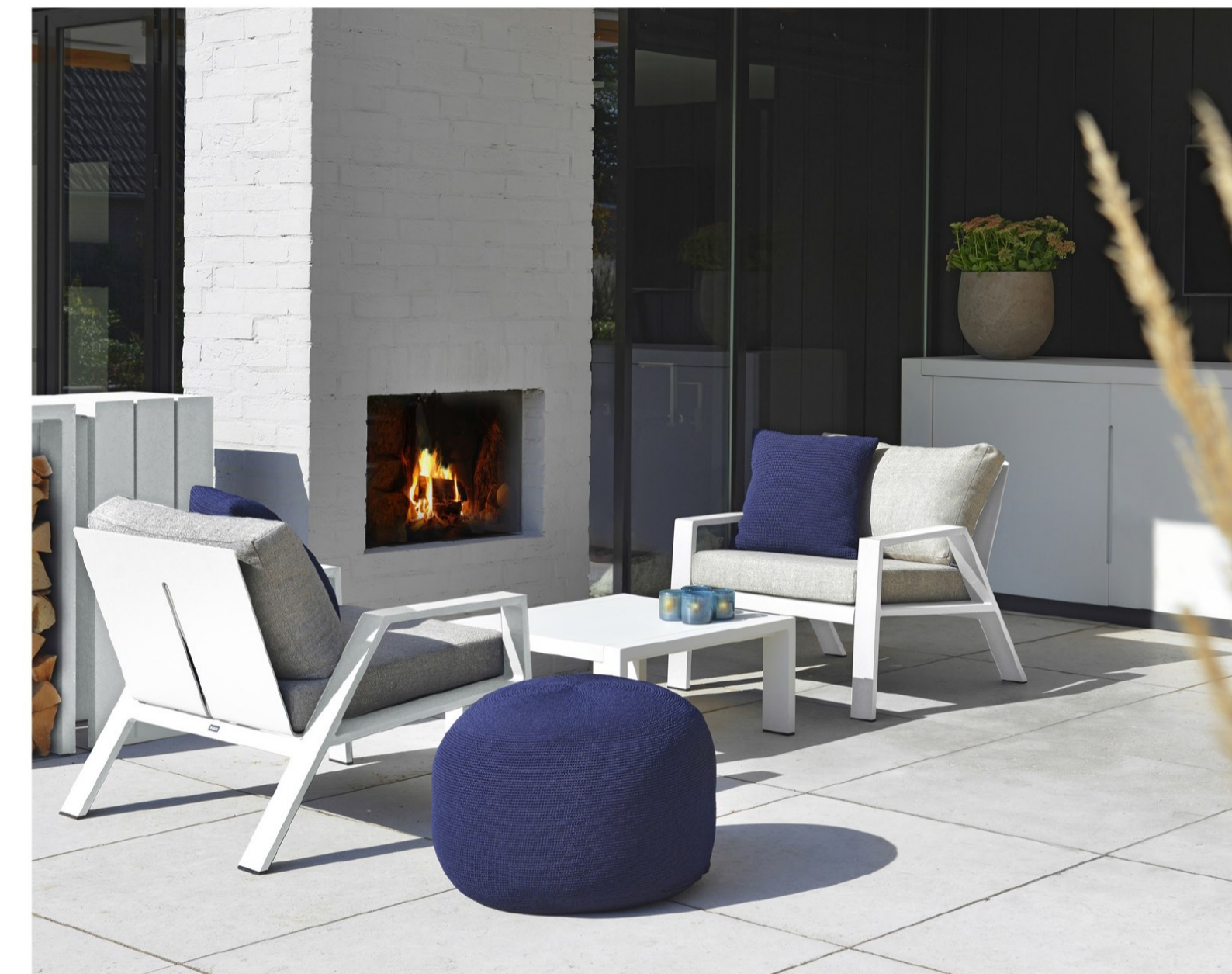
Borek Panama lounge chair, side table and sideboard

Anno 2016, enkele jaren na het genoemde telefoongesprek, zijn twee families van de hand van Frans van Rens opgenomen in de uitgebreide collectie van Borek. Allereerst was er de Viking-serie en meer