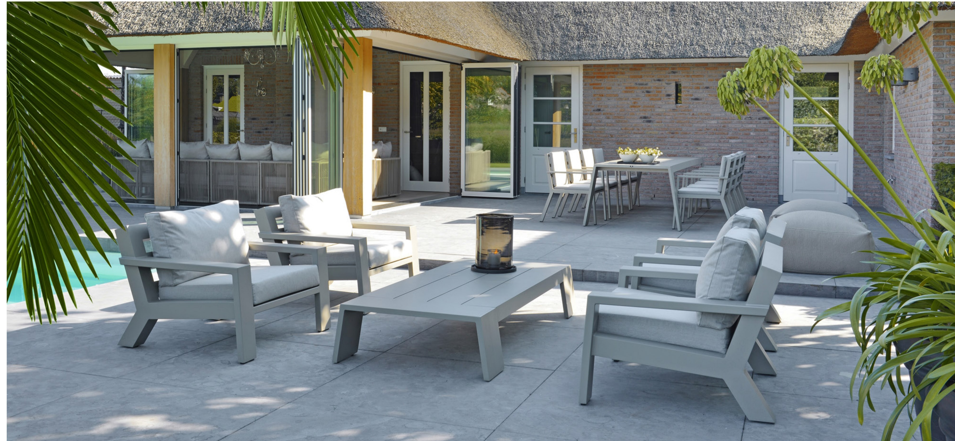
Borek viking 4P lounge set en 8P dining set in aluminium

EXCELLENT BEURS ROTTERDAM AHOY ROTTERDAM 6 T/M 9 OKTOBER 2016